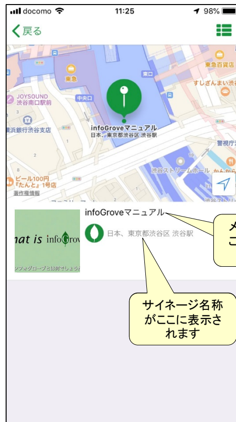
スマホをシェイク または画面をタップ すると次の画面 に移動します