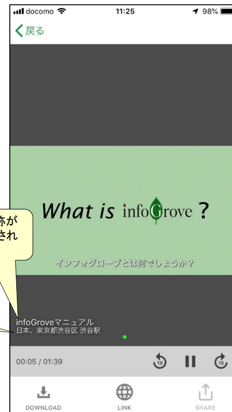
メディアを選択す ると画像・動画が 表示されます。